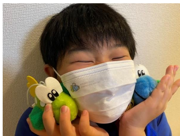
▲抽選会で「むっぴー」マスクが当たり大喜びのお子様

また、2021年6月下旬より、感染症対策の一環として「佐賀空港リムジンタクシー」「佐賀空港アクセスバス」の運転士の皆様が着用するほか、レンタカーターミナルの受付にてレンタカーをご利用のお客様に配布しております。